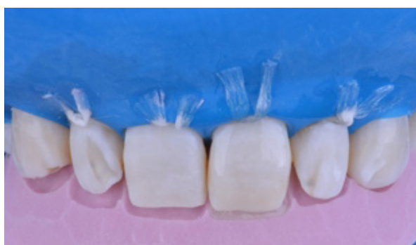
Figura 08 - Início da estratificação da resina composta Charisma® Diamond (Kulzer).