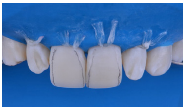
Figura 09 - Com centrais finalizados, delimitamos área de espelho para ajustar a anatomia primária dos dentes.