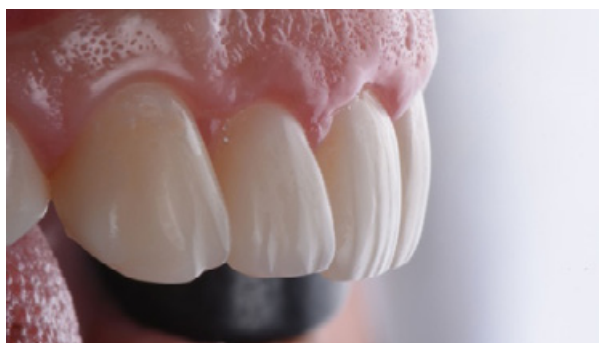
Figura 11 - Acabamento e polimento com discos, borrachas e pasta diamantada.