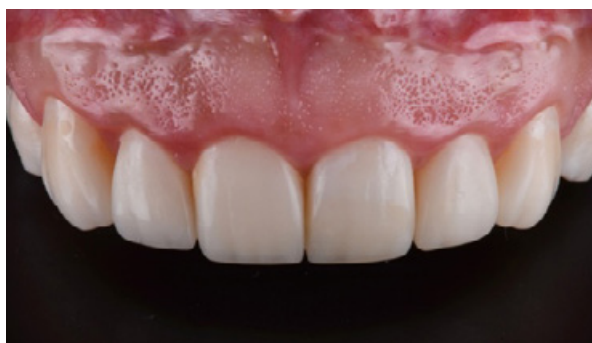
Figura 12 - Caso finalizado.