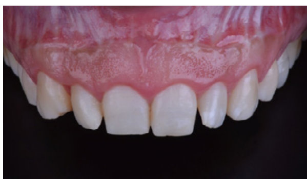
Figura 01 - Caso inicial.