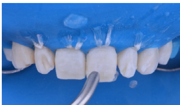
Figura 05 - Aplicação de jato de óxido de alumínio e água para remoção do esmalte aprismático.