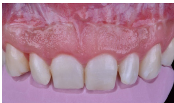
Figura 02 - Prova da guia palatina para orientar as reconstruções das bordas incisais.