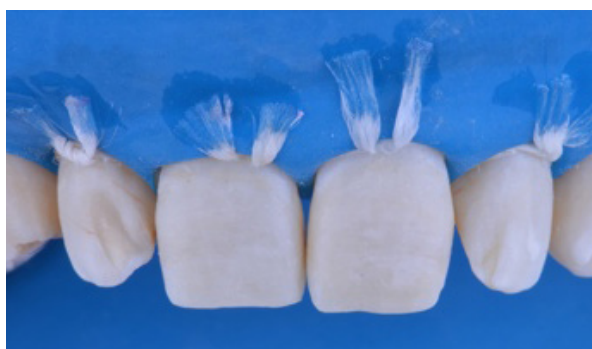
Figura 04 - Isolamento absoluto do campo operatório.