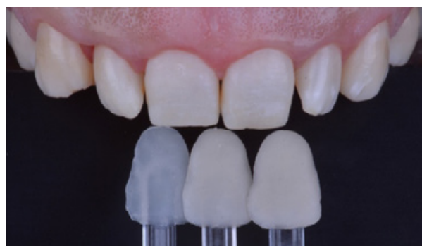
Figura 03 - Seleção da cor da resina composta com escala personalizada.